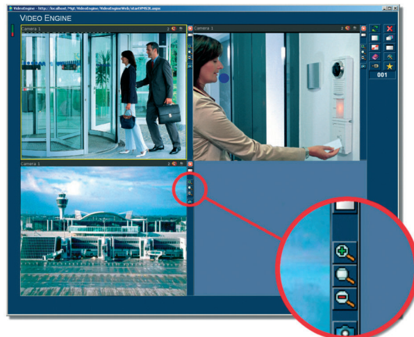
Функция цифрового увеличения изображений с каждой камеры