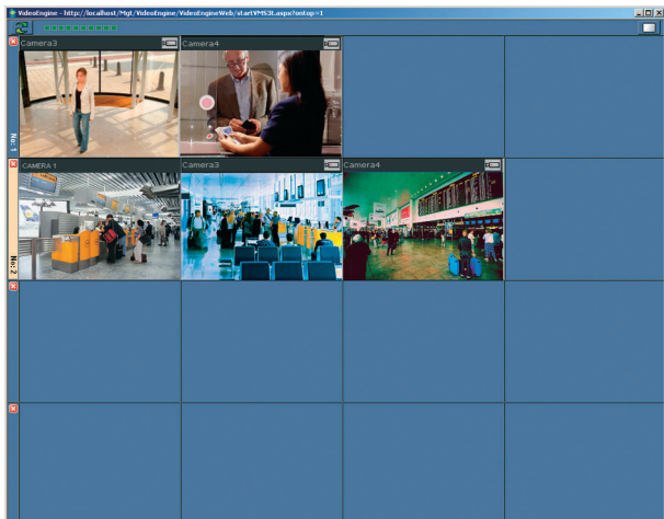
Пример тревожной матрицы с 2 активными тревожными ситуациями